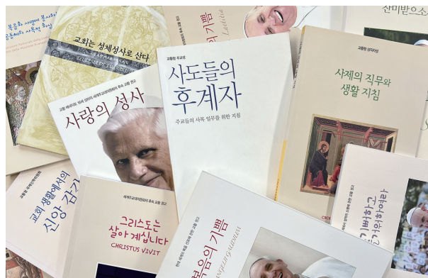
공의회는 주교들이 신적 제도에 따라 사도들의 자리를 계승하였다고 가르친다. 교황청 주교성에서 발표한 주교들의 사목 임무를 위한 지침 「사도들의 후계자」

공의회는 이 항의 시작에서 언급된 봉사 직무의 영속성과 관련하여, 주님께서 으뜸 사도인 베드로에게 맡기어 로마 주교에게 전수된 임무가 영속하듯이, 사도들의 “교회 사목 임무”도 주교들의 품계에서 영속한다고 설명합니다. 이 주교들의 사목 임무를 통해서 하느님 백성이 복음을 듣고, 미사를 봉헌하며, 교회에 봉사합니다.