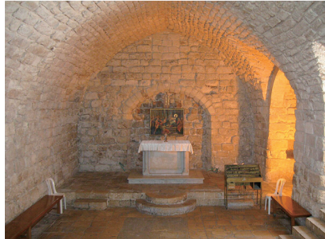
나자렛 회당 성당 내부