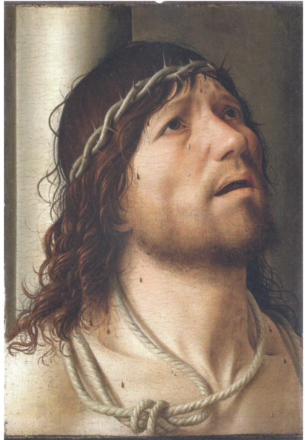
안토넬로 다 메시나, <기둥에 묶인 그리스도>, 1476-1478년경, 목판에 유채, 29.8cmx21cm, 루브르 박물관(프랑스 파리)

이탈리아 시칠리아섬의 북동부 항구도시 메시나(Messina) 태생인 안토넬로는 베네치아를 중심으로 활동하였습니다. 당시 베네치아는 동양과 서양, 남유럽과 북유럽 간 활발한 경제 및 문화교류의 장이었습니다. 그는 이곳에서 북유럽의 플랑드르 미술을 접하게 됩니다. 플랑드르는 오늘날 벨기에와 네덜란드 지역인데, 플랑드르 미술은 깊은 정신성이 응축된 극사실