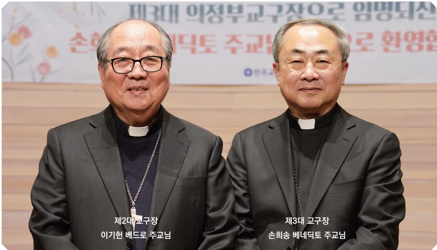
제2대 교구장 이기현 베드로 주교님

발행인 이기현 • 편집 홍보국 • 주소 11674 경기도 의정부시 신흥로 261 의정부교구청 • 전화 031-850-1400(대표), 1433-5(홍보국)